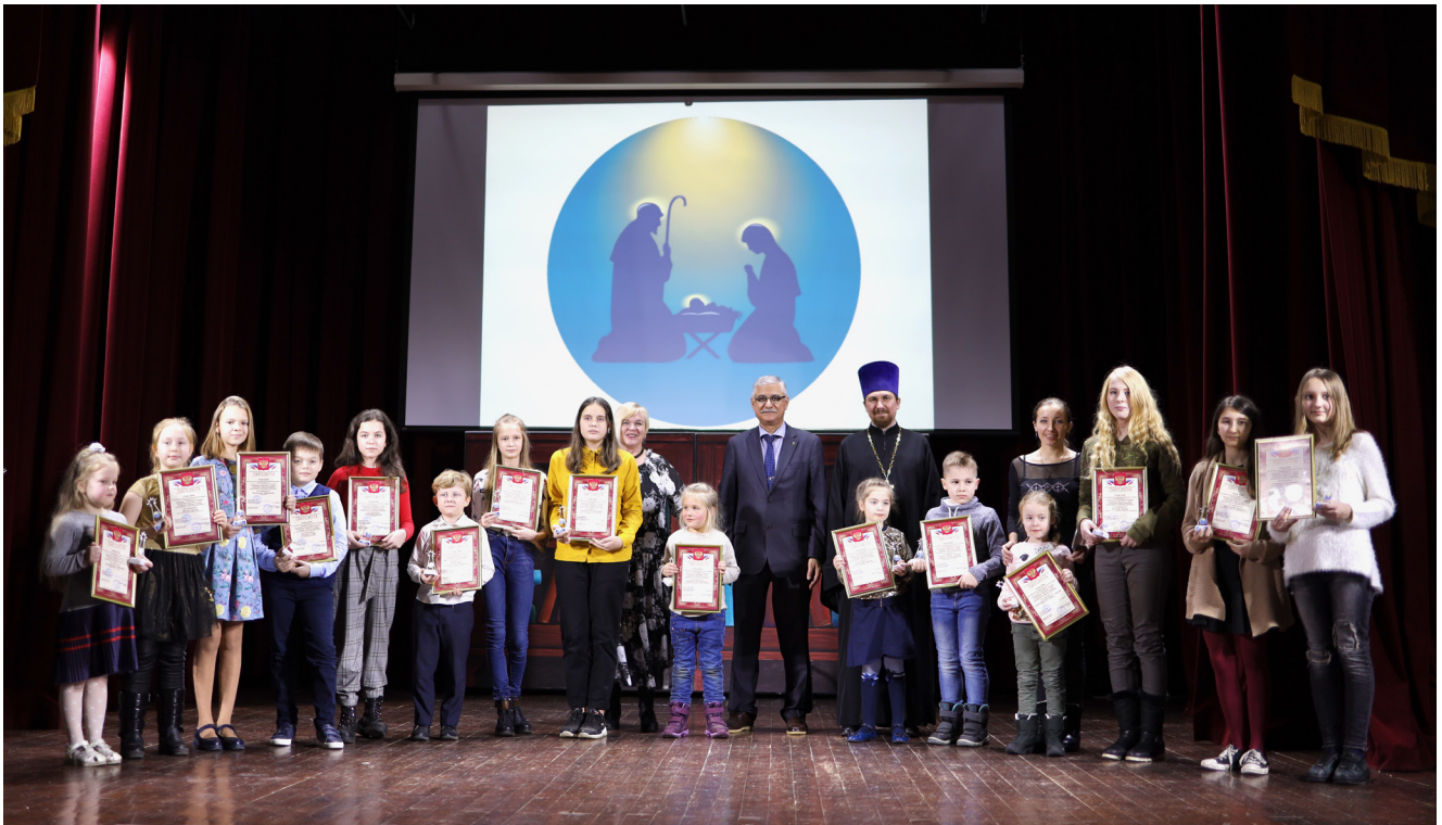
10 января. Церемония награждения победителей XIX районного конкурса «Рождество Христово–2020»