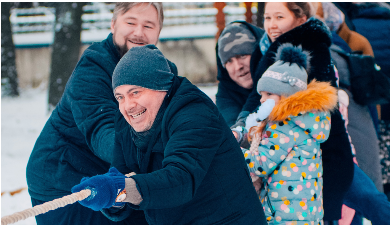
12 января. Рождественские гуляния. Казанский храм с. Молоково.