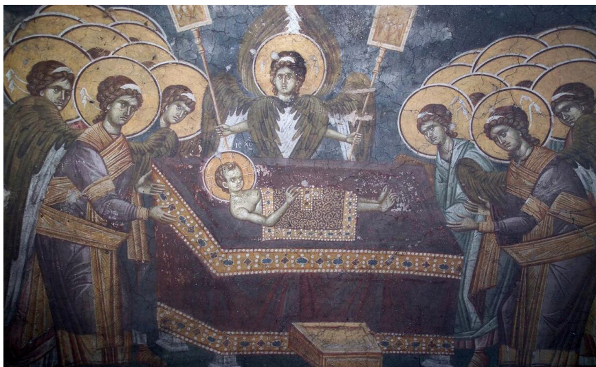
Небесная Литургия. Фреска монастыря Грачаница. Сербия, XIV в.

Поговорим о богослужебном гимне, который поётся церковным хором и возглашается священником во время великого входа—о Херувимской песни.