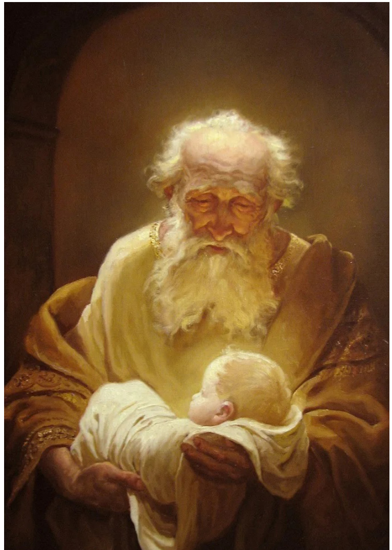
Симеон и Иисус. А.А.Шишкин, 2012 г.