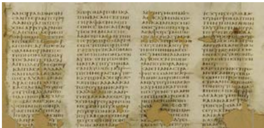
Синайский кодекс, список Библии на греческом языке, считается древнейшей полной унциальной пергаментной рукописью Библии. IV в. по Р.Х.

Перевод Ветхого Завета на древнегреческий язык, над которым трудился праведный Симеон Богоприимец, называется «Септуагинта» («перевод семидесяти толковников» или «перевод семидесяти старцев»). Греческий текст Септуагинты был широко распространён, однако оказался полностью отвергнут талмудическим иудаизмом (основная форма иудаизма с VI века), что обусловлено, в том числе, фактом авторитетности этого перевода в Церкви. Септуагинта является самым древним известным переводом Ветхого Завета на древнегреческий язык. Она сыграла важную роль в истории Христианской Церкви, став, по существу, каноном Ветхого Завета на греческом языке, с которого впоследствии были сделаны переводы на другие языки, в том числе первый перевод на церковнославянский.