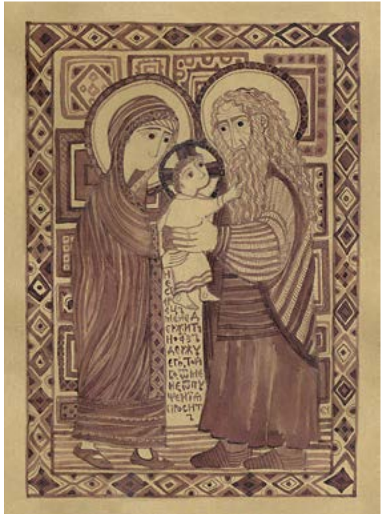
Сретение Господне. Художник Елена Черкасова. Графика. 2014 г.