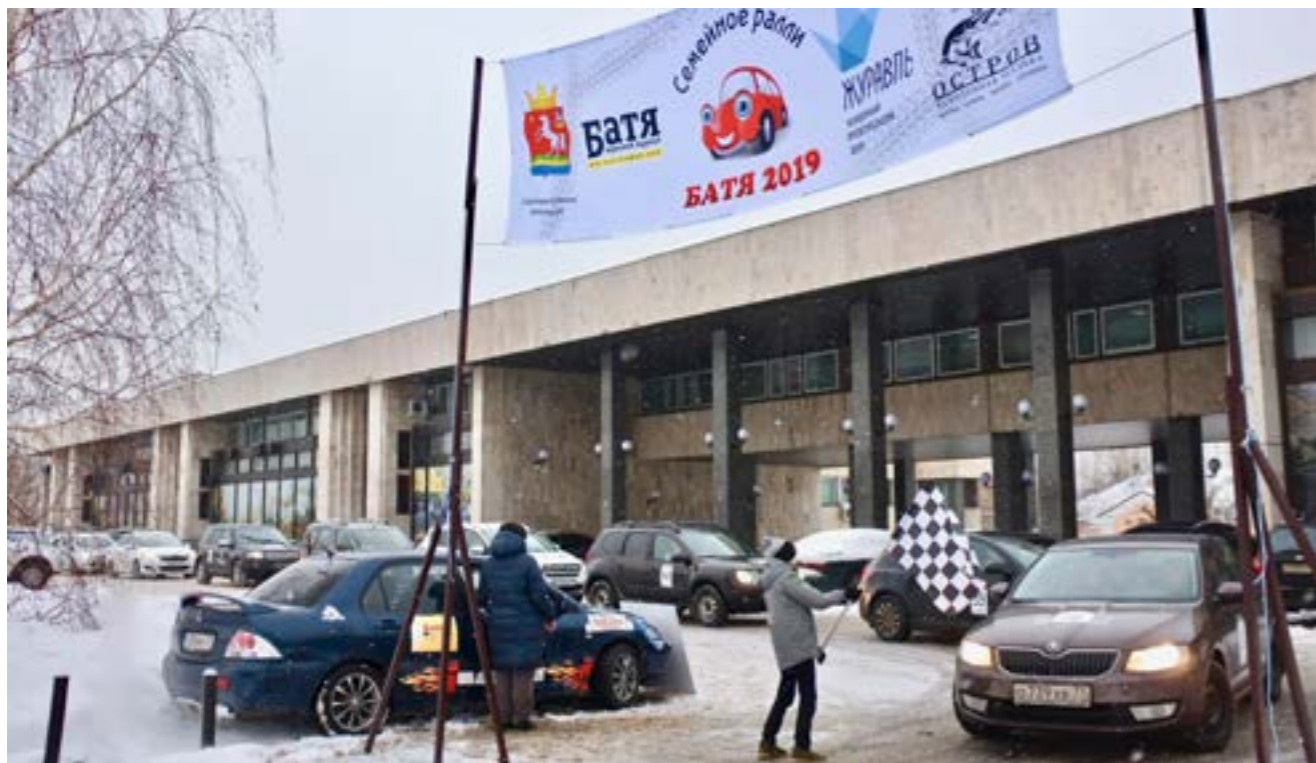
3 января. Семейное авторалли «Батя». Старт 60-ти семейных экипажей от Музея Победы на Поклонной горе