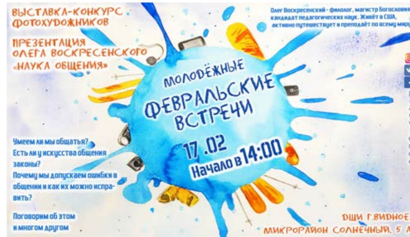
17 февраля. Ждём всех, кому интересно научиться общаться.